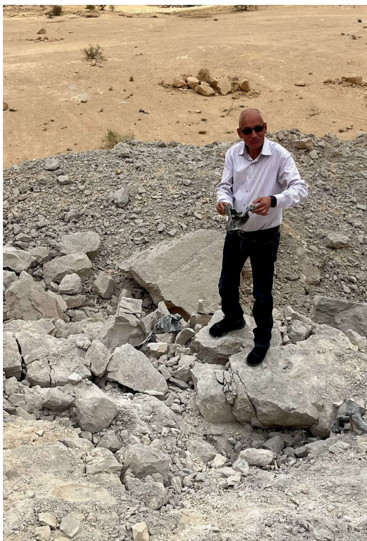
נפילות בשטח המועצה