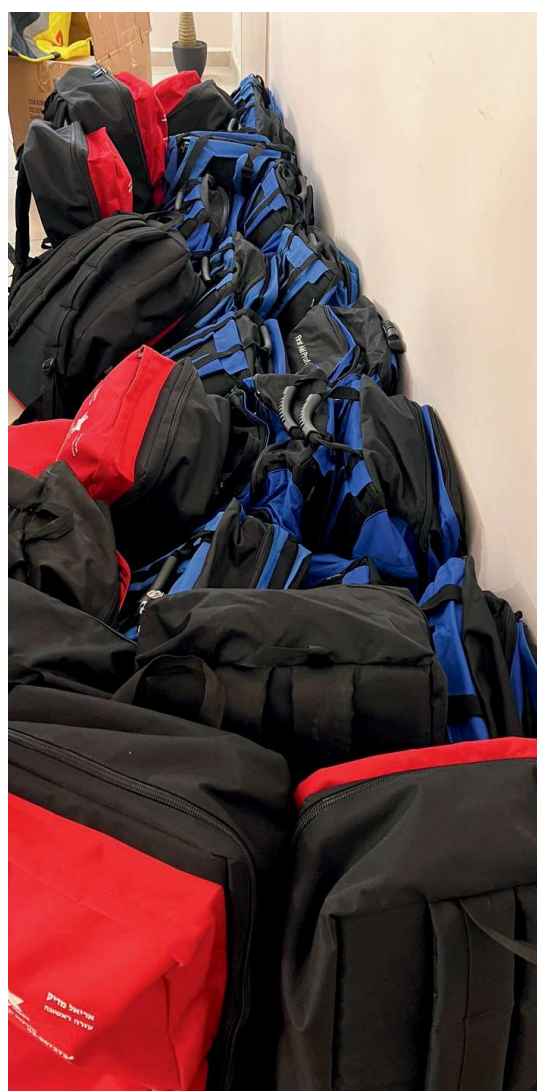
חלוקת תיקים לחובשים מתנדבים